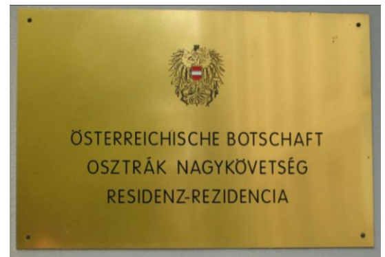
Ambasciata Austriaca in Ungheria