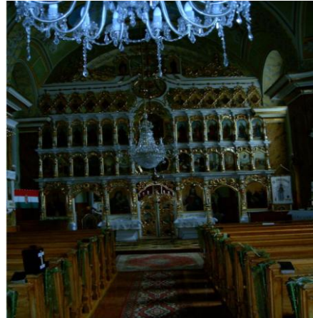
12 Chiese Greco Cattoliche, 3710 mq